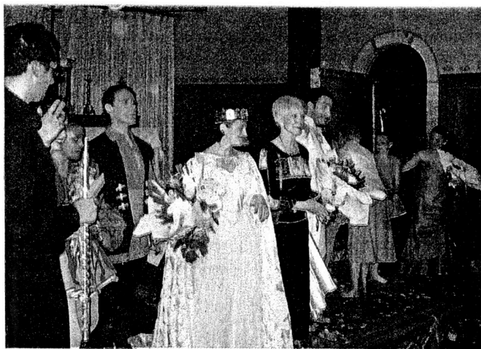
Mady Mesplé entourée des chanteurs et musiciens.

La qualité et l'enthousiasme des artistes, la précision et le rythme dynamique de la mise en scène, l'acoustique incomparable de l'église, ont véritablement fasciné